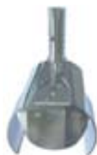
Ø150/160 mm Stål - ler - beton & pvc Vvs nr 154390018