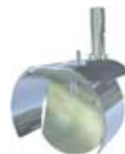
Ø200 mm Stål - ler & beton Vvs nr 154390021 Pvc Vvs nr 154390020