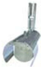
Ø100/110mm Stål - ler - beton & pvc Vvs nr 154390016