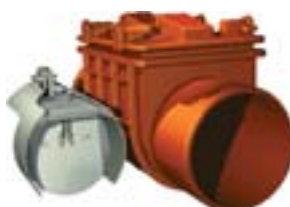
Rottespærre Ø110 mm Til montage i Staufix Ø110 mm højvandslukker model 71 Vvs nr 154391016